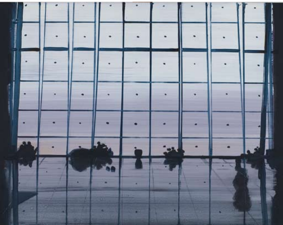
Christine Philipp Airport 2007 olie op doek, 60x80 cm