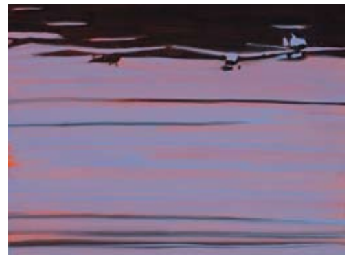
rechts boven: Christine Philipp Flugzeuge 2007, olie op papier op board, 27x36 cm