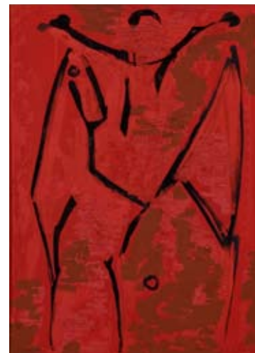
Marino Marini (1901-1980)

De reputatie van The European Fine Art Fair als 's werelds mooiste en best verzorgde kunstbeurs is reeds jaren gevestigd. Dat gold tot voor enkele jaren met name voor het aanbod aan 'Old Masters' en 'Antiquities'. De spectaculaire groei, wereldwijd, in de belangstelling voor moderne en hedendaagse kunst is natuurlijk ook niet voorbijgegaan aan TEFAF. De 'Modern Section' is sinds een aantal jaren uitgebreid met de internationaal meest toonaangevende galeries en overtreft inmiddels in expositie oppervlak alle andere secties. BORZO toont in stand 442 de aanwinsten aan een breed geïnteresseerd en internationaal publiek. TEFAF Maastricht van 7 t/m 16 mrt 2008