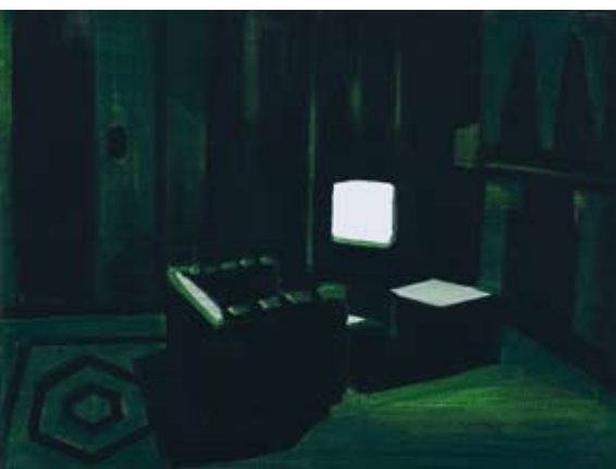
Christine Philipp Them II 2007, olie op doek, 30x40 cm

'Jonge schilders werken abstract', kopt NRC (20 oktober 2007) boven een recensie naar aanleiding van de uitreiking van de Koninklijke Prijzen voor de Vrije Schilderkunst en de expositie ervan in het Haags Gemeente Museum.