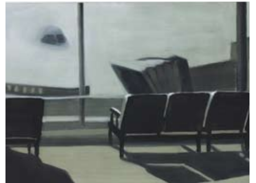
Christine Philipp Wartehalle 2007 olie op papier op board, 29.7x42 cm